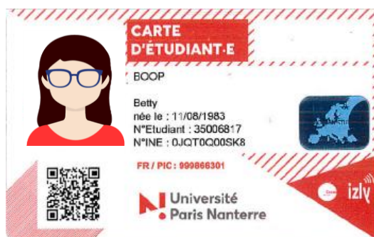
Beispiel eines europäischen Studierendenausweises, Universität Paris Nanterre

Die European Student Card wurde auf Basis der European Student Card Initiative entwickelt. Es handelt sich um den normalen Studierendenausweis einer Hochschule, der zusätzlich mit einer europäischen Nummer, einem QR-Code und einem Schriftzug versehen ist.